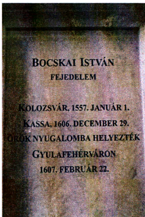
Településünk névadójának siremléke

Gyulafehérváron szívet melengető élményben volt része a csapatnak: a Szent István király által alapított székesegyházban nagyjaink sírjának koszorúzása közben váratlanul felcsendült a templom orgonáján nemzeti imádságunk, a magyar Himnusz, amelyet meghatódva és büszkén énekeltek el a megszentelt falak között a gyerekek.