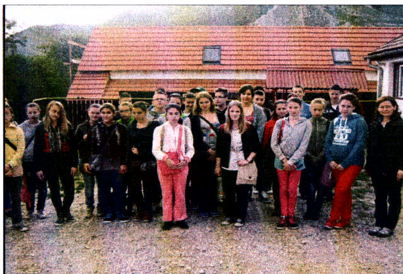
A torockói szálláson háttérben a Székely-kővel

A szállásra érkezve lenyűgöző látványt nyújtott számukra a Torockó határában magasodó Székely-kő, amely mögül a helyiek szerint bizonyos évszakokban kétszer kel föl a Nap. Az első napfelkeltét a gyerekek nagy izgalommal várták, és meg is örökítették.